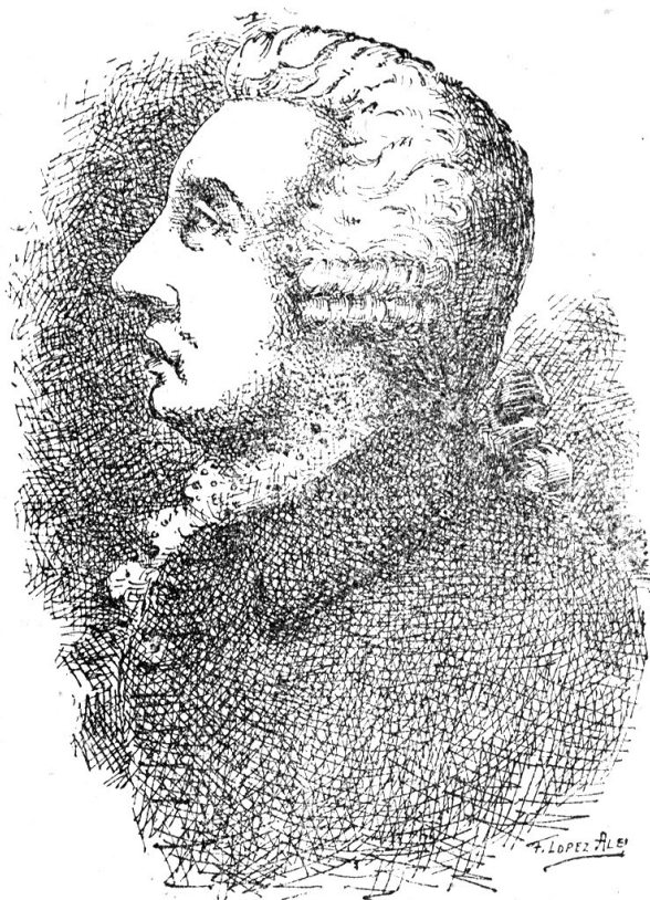
EL CONDE DE PEÑAFLORES