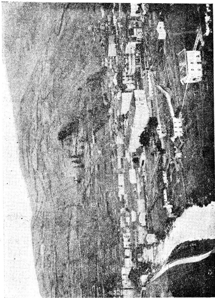
VISTA PANORÁMICA DE VERGARA