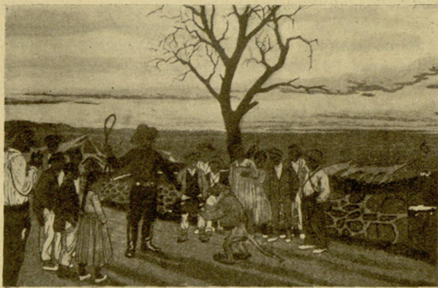
EL HÚNGARO.—Cuadro de José Arrue

Los hermanos Arrue, jóvenes pintores vizcainos, están llamados á ocupar puestos envidiables en el campo del arte, si prosiguen decididamente en el estudio y la observación.