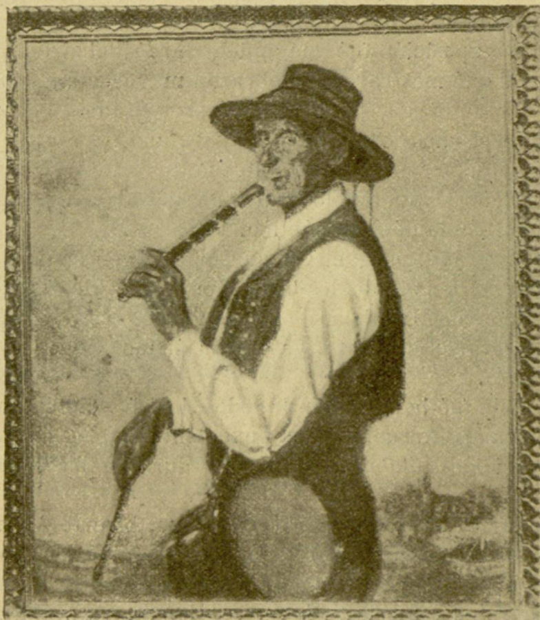
CHISTULARI. - Cuadro de Alberto Arrue