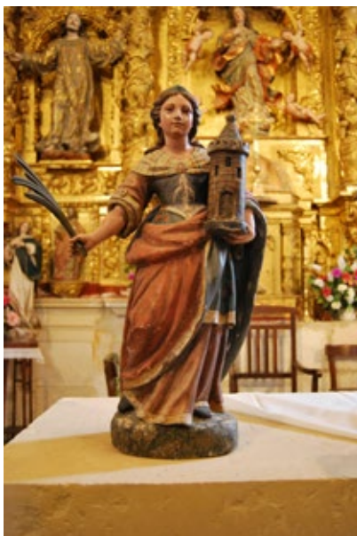
Fig. 2 Santa Bárbara. 1781. Parroquia de La Asunción. Argote.

un hijo en La Puebla de Arganzón como veremos más tarde. Por tanto, el período en el que pudo recibir formación en Madrid queda acotado desde 1782 hasta 1788. Mauricio hubiese iniciado su aprendizaje cortésano con 22 años para finalizarlo con 28 años. Pese a lo dicho tenemos serias dudas sobre la veracidad de la estancia madrileña, acrecentadas por la atribución realizada por Fernando Tabar Anitua de la imagen de Nuestra Señora del Rosario de Antezana de la Ribera fechada en 1785 55 . A favor de la posible formación académica, hemos de destacar la mejora cualitativa entre las obras fechadas a inicios y las de fines de esa década. Cierto es que la misma no ha de ser justificada obligatoriamente por desplazamiento algu-