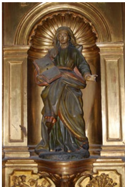
Fig. 3 Santa Ana. Retablo de Nuestra Señora del Rosario. La Puebla de Arganzón.