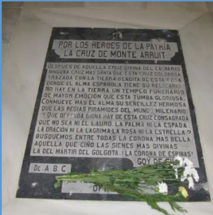
Fosa común de los héroes de Monte Arruit, cementerio de la Purísima Concepción de Melilla

En esta obra se recoge la edición facsímil del resumen del denominado Expediente Picasso , editado en 1931. Hasta 1990 fue la única publicación que permitió conocer, en parte y de manera aproximada, el proceso de investigación y de depuración de responsabilidades del conocido como Desastre de Annual . Cerca de 10.000 españoles ( las cifras exactas a día de hoy no se han podido determinar) murieron en lo que , más que una batalla, fue una salvaje matanza a manos de las cabilas rifeñas. Con ocasión del centenario del Desastre , y sin ánimo de polemizar estérilmente sobre el significado de la guerra de Marruecos, esta obra pretende ser un modesto homenaje a los españoles olvidados de aquella tragedia, que hirió y traumatizó a la sociedad española en su momento, y que condicionó nuestro devenir histórico en los años posteriores a 1921.