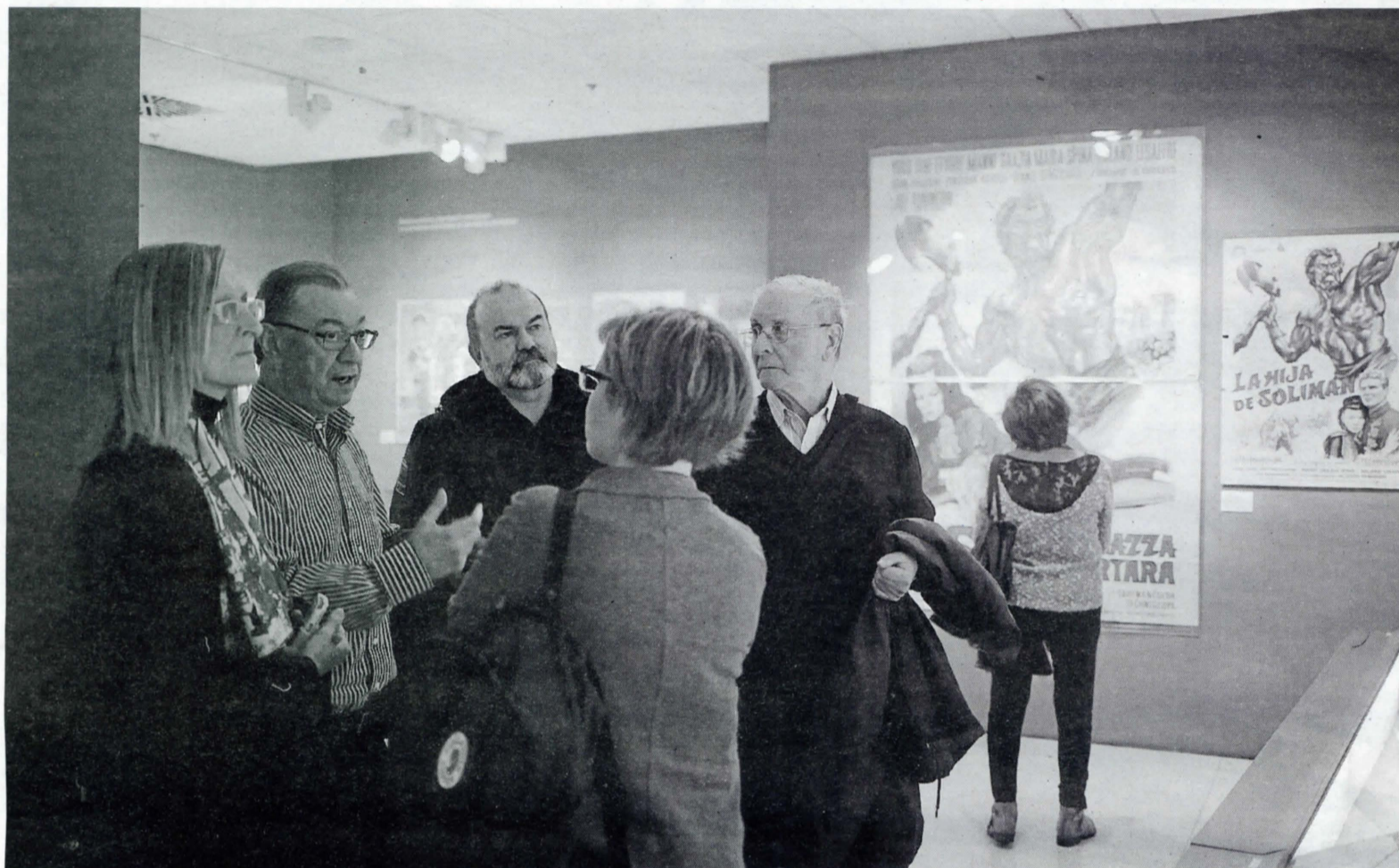
Representantes de las tres fundaciones vascas se reunieron ayer en Bilbao para asistir a la exposición de la Sala Ondare.

SAN TELMO EL MUSEO DONOSTIARRA RECUPERARÁ AL GRUPO 'GAUR' EN UNA EXTENSA MUESTRA. PÁGINAS 54-55